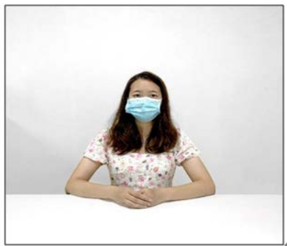
图2：正前方第一机位效果图