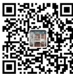
“北大外院教务办”微信二维码

请取得复试资格的考生提前安装微信应用，并于 3 月 16 日下午 15:00 前用微信扫描下方二维码，将“北大外院教务办”加为好友。加好友时须发送： 报考的专业名称（亚非语言文学专业还需有方向名称）+姓名+报名时在北大研招网提交的手机号码 ，方可通过验证。逾期不加好友的，将视为放弃复试。